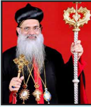
H.H. BASELIOS MARTHOMA PAULOSE II

പത്തൊമ്പതാം സകീർത്തനത്തിൽ ദാവീദ് ഇപ്രകാരം പ്രാർത്ഥിക്കുന്നുണ്ട്. 'ദുഷ്ടന്മാർ എന്നിൽ അധികാരപ്പെടാതിരിക്കാനും പാപങ്ങളിൽ നിന്നു ഞാൻ വെടിപ്പുള്ളവനായിരിക്കാനുമായിട്ട് അന്യായങ്ങളിൽ നിന്നും നിന്റെ ദാസനെ തടയണമെ. എന്റെ സഹായകനും എന്റെ രക്ഷിതാവുമായ കർത്താവേ! എന്റെ വായിലെ വചനങ്ങൾ നിന്റെ ഉഷ്ടപ്രാകരവും എന്റെ ഹൃദയത്തിലെ ധ്യാനം നിന്റെ മുമ്പാകെയും ഇരിക്കണമെ'. ഈ നാളുകളിൽ ഓരോ വിശ്വാസിയുടെയും ഹൃദയങ്ങളിൽ നിന്നും ഉയരേണ്ട അപേക്ഷയായ നയാകണലിത്. അധർമ്മകൃത്യങ്ങൾ വഴികളിലൂടെ സാത്താൻ നമ്മിൽ അധികാരം സ്ഥാപിക്കാതിരിക്കുവാനും പരിപൂർണ്ണ ദൈവാശ്രയത്തോടെ ജീവിക്കുവാൻ നാം ഉത്സാഹിക്കണം. മാനുഷികമായ ബലഹീനതകളിൽ നമുക്ക് ബലം നൽകി സഹായിക്കുന്ന ദീപിതാവായ നമ്മുടെ ഹൃദയത്തോടു നമ്മുടെ കാതുകളെ ചേർത്ത് അവനുള്ളവരായി ജീവിക്കുവാൻ നമുക്ക് പരിശ്രമിക്കാം.