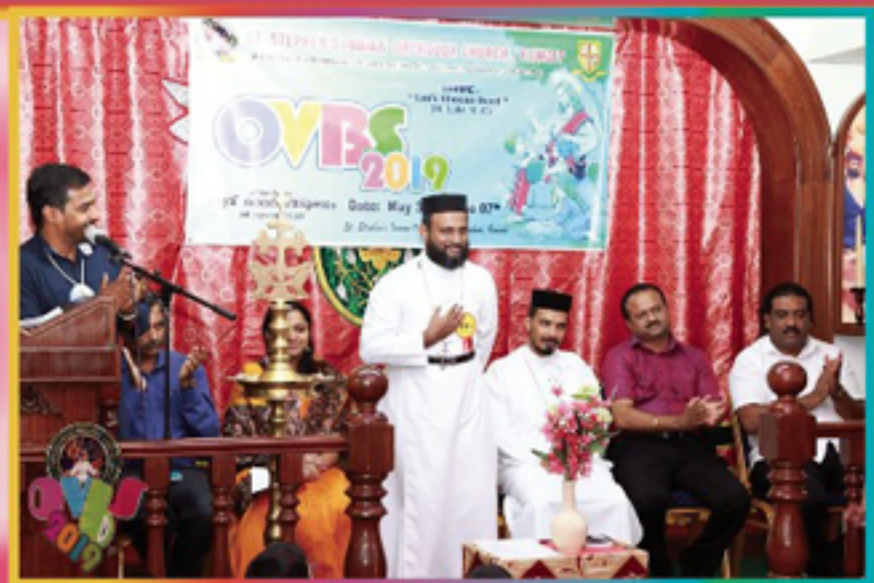
Inauguration of St. Stephens Orthodox Church OVBS 2019.